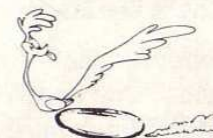
TABLE DES MATIERES

...d'avoir fait l'acquisition du jeu Looney Tunes™ Road Runner™ de SUNSOFT. Lisez très attentivement les instructions de ce livret avant de commencer à jouer. Ainsi vous jouerez mieux et pourrez apprécier au maximum ce jeu. Prenez soin de placer ce manuel en lieu sûr.